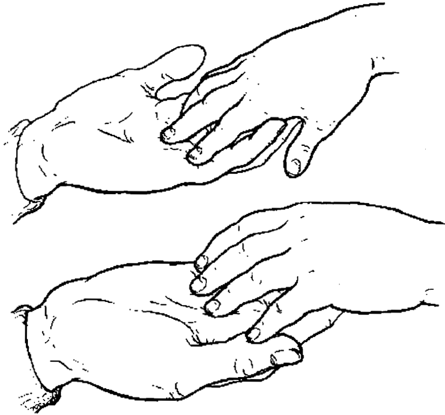
Bild 2: Die Hände des Lehrers liegen unten - bereit für das Kind, sie als Werkzeug zu benutzen.